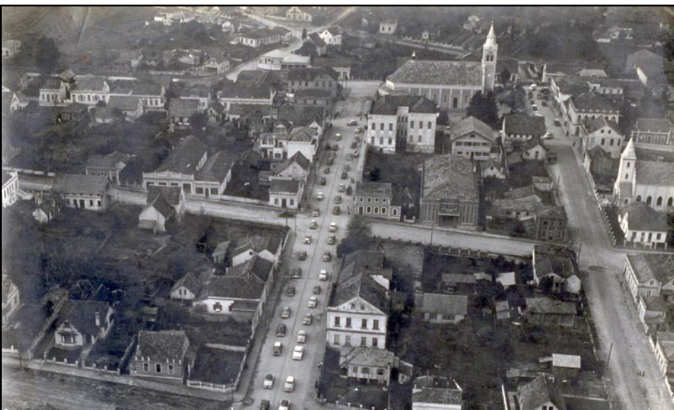
▲ Vista aérea de Rio Negro na década de 50