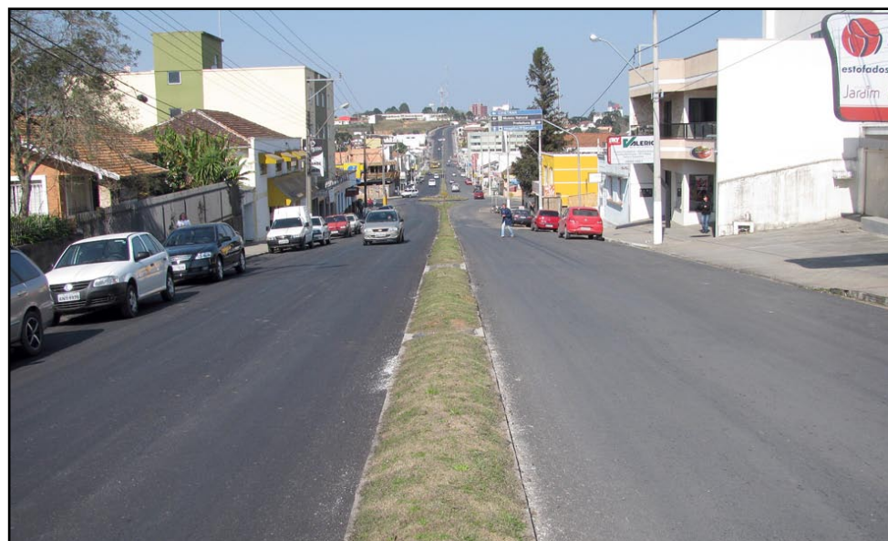
▲ Obras de pavimentação