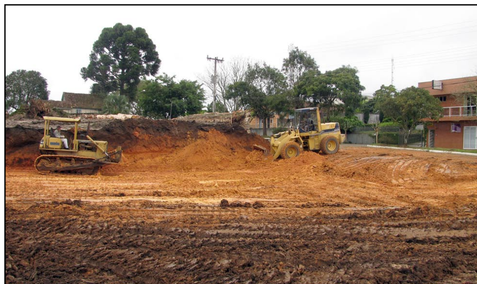
▲ Início das obras para construção da UPA