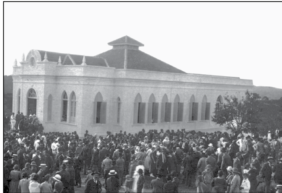
▲ Inauguração do Hospital Bom Jesus, em 1927