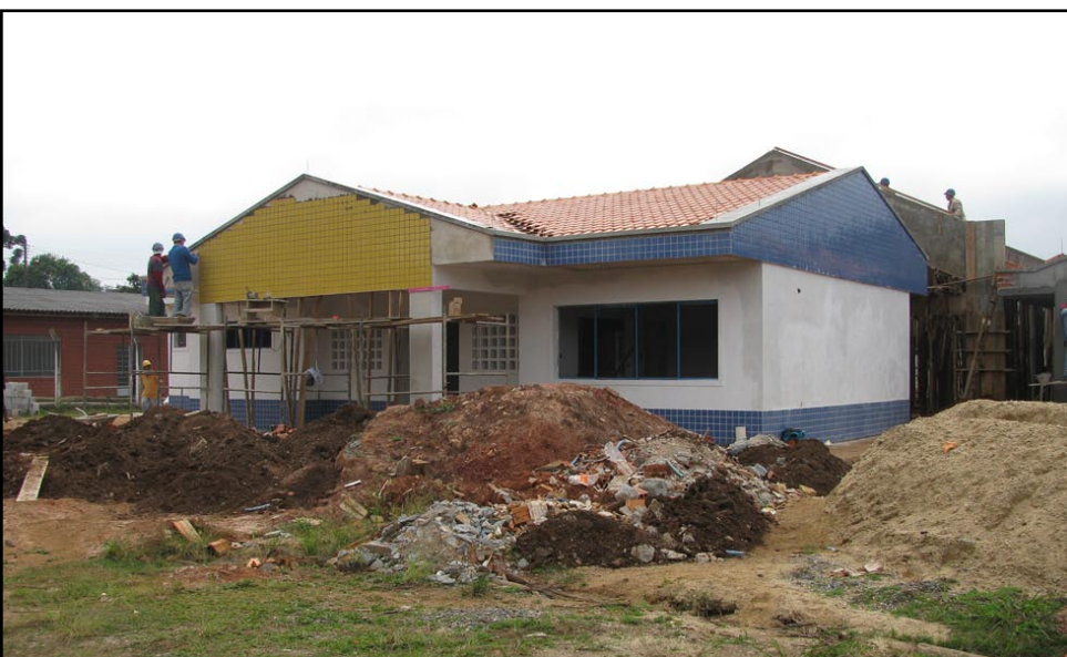
▲ Creche Pró Infância