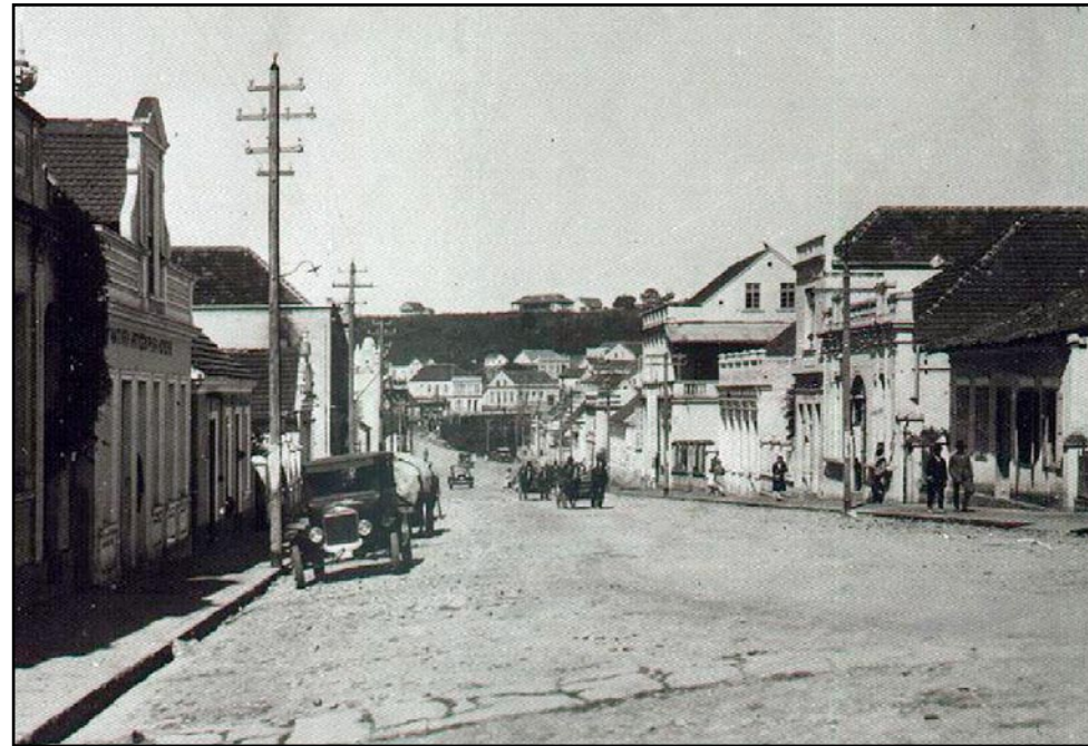
▲ Rua XV de Novembro, em 1925