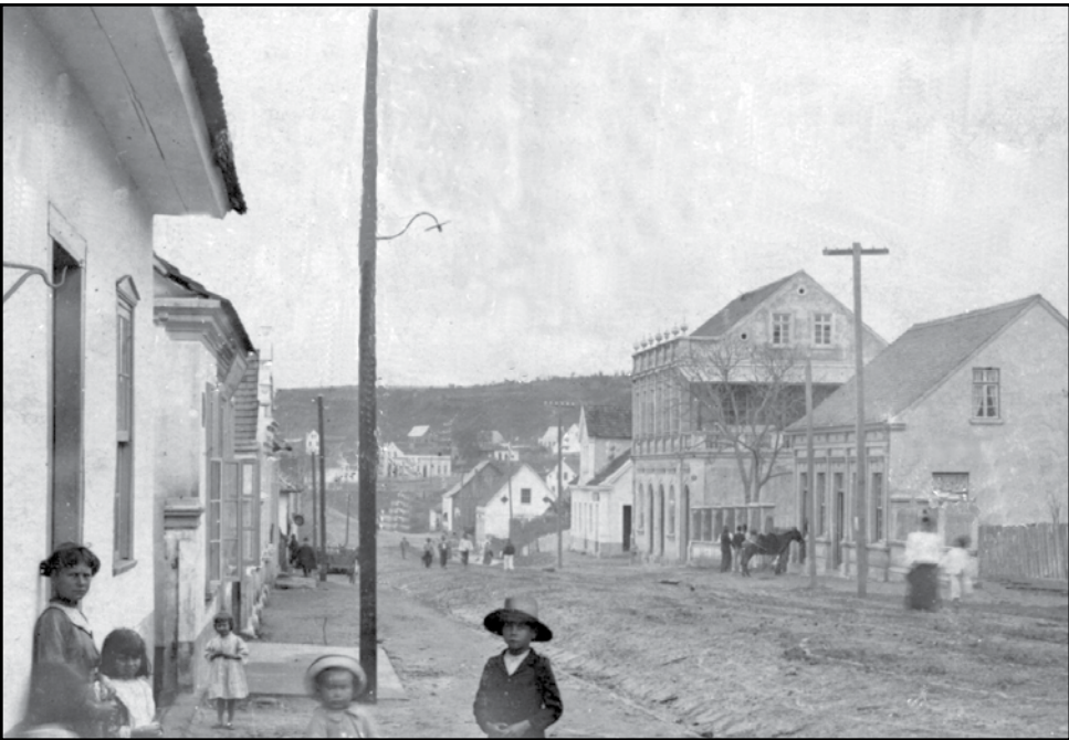
▲ Rua XV de Novembro, em 1910