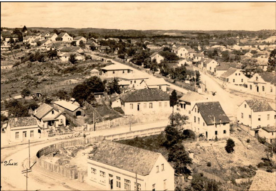
▲ Vista da Rua Barão do Rio Branco e Vila Militar