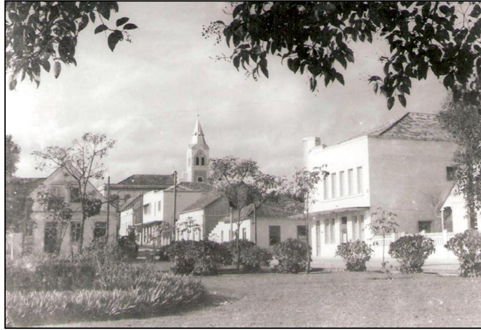
▲ Praça João Pessoa, na década de 40