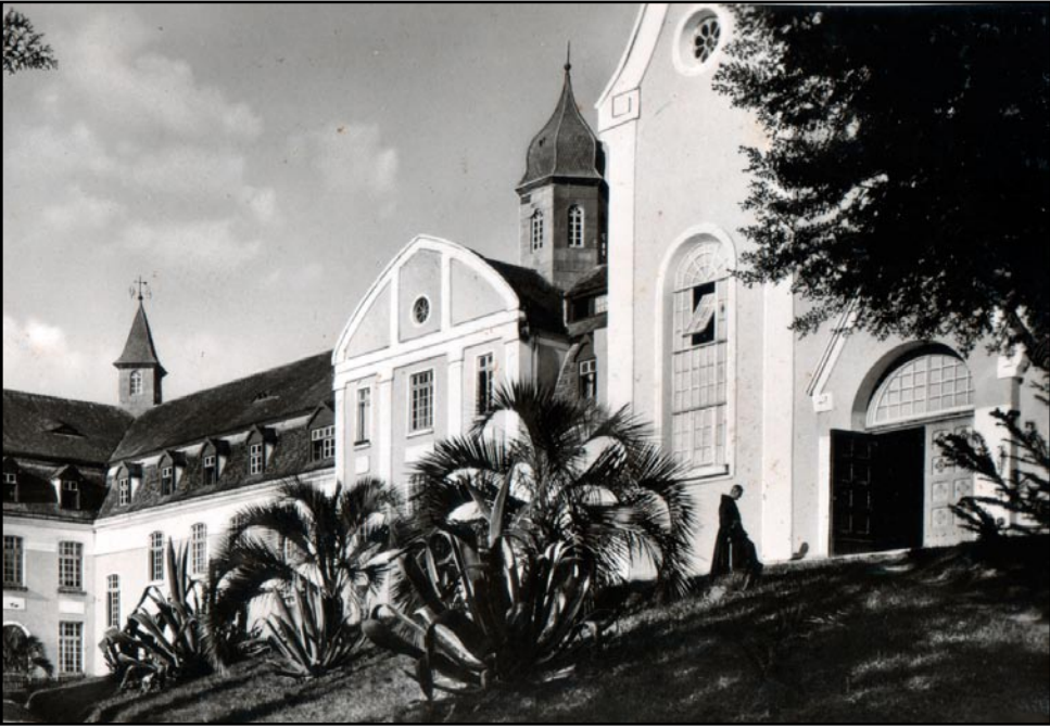
▲ Seminário Seráfico, nos tempos dos franciscanos

Neste dia 15 de novembro, os munícipes rionegrenses comemoram 140 anos de emancipação política do município