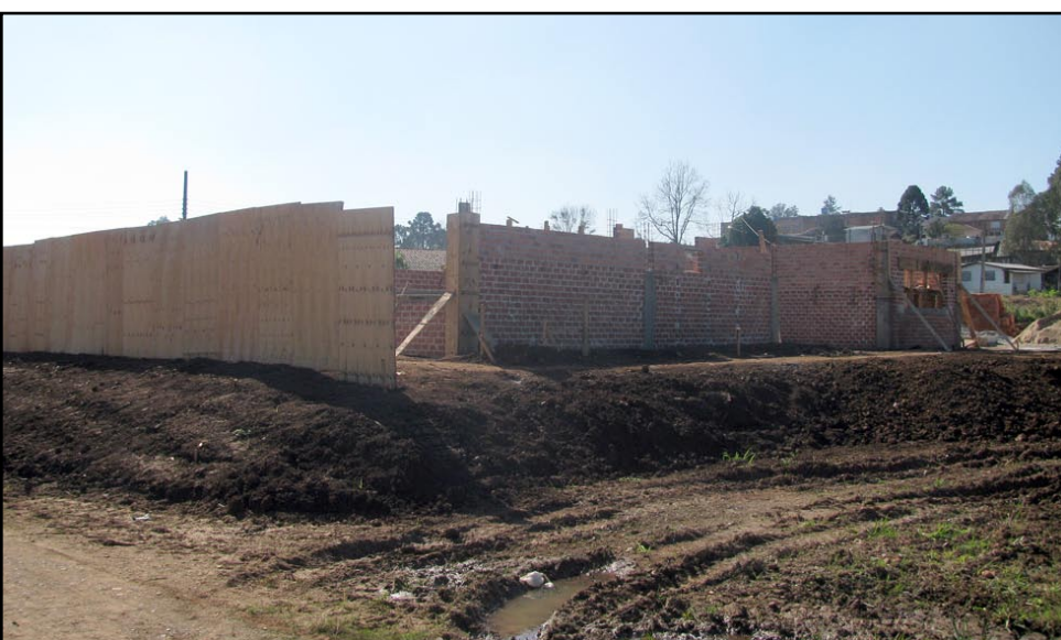
▲ Biblioteca Cidadã