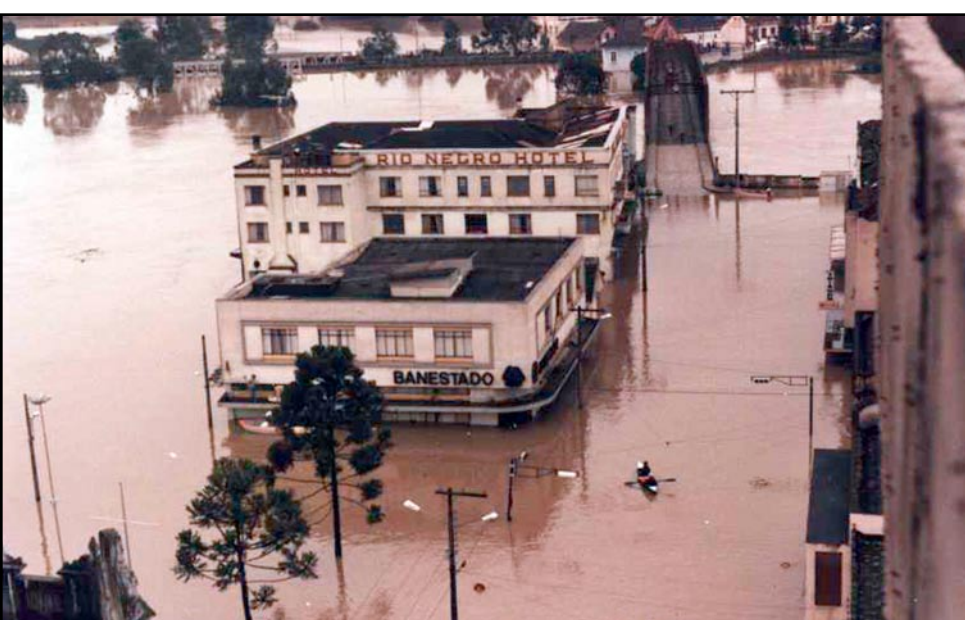
▲ Entrada da cidade, imediações do Hotel Rio Negro, durante a enchente de 1992

Mais recentemente, as águas do rio Negro voltaram a assolar os moradores de Rio Negro e Mafra, deixando vários desabrigados e prejuízos para as famílias ribeirinhas.