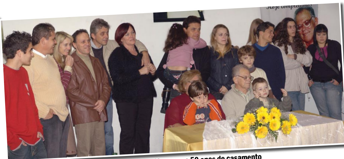
Curtindo com a família os seus 50 anos de casamento