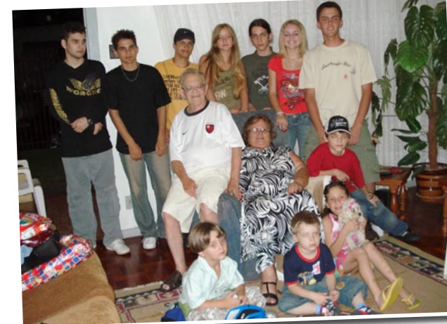
Com a dona Erna e os netos festejando o Natal de 2006