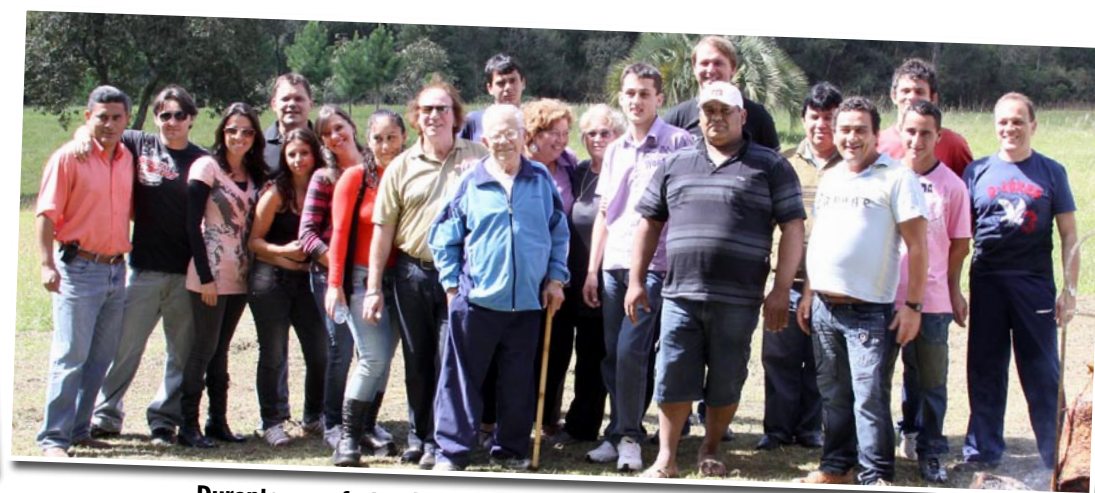
Durante a confraternização do Dia do Trabalhador 2010. O patriarca da família Gazeta não poderia deixar de ser o convidado de honra