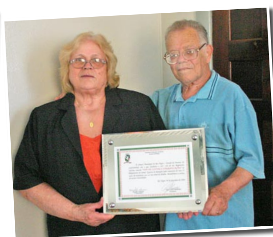
Homenagem do município de Rio Negro pelos 20 anos da Gazeta