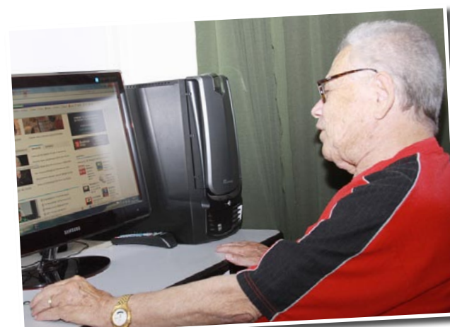
Um homem à frente do seu tempo... apaixonado por tecnologia, cultura e informação