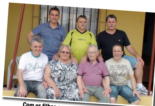
Com os filhos em seu aniversário em 2009