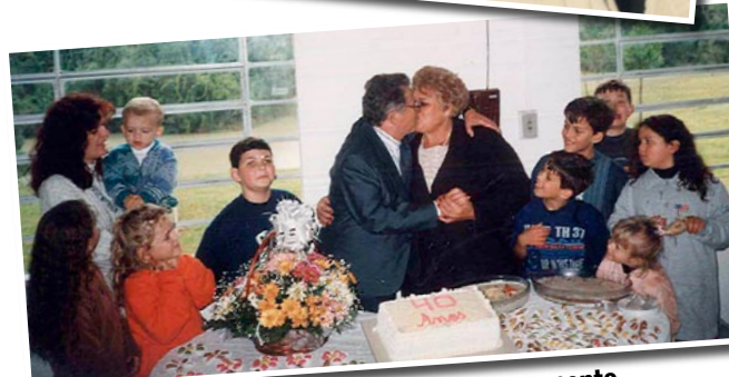
Comemorando os 40 anos de casamento